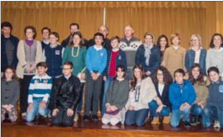
Participantes en la fase final de la II Olimpiada de Religión.

En esta II Olimpiada han participado 47 colegios, con un total de 1300 alumnos.