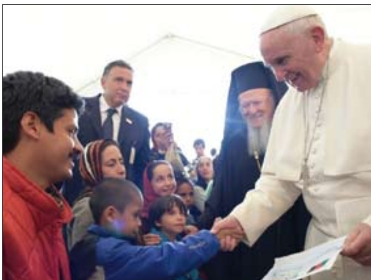
El Papa recibió muchos dibujos de niños sirios que reflejaban el horror que están viviendo.

En Lesbo esperaban al Papa el Primer Ministro Tsipras, el Patriarca de Constantinopla, Bartolomé I, el Arzobispo de Atenas y de toda Grecia, Jerónimo II y el Presidente de la Conferencia Episcopal Griega,