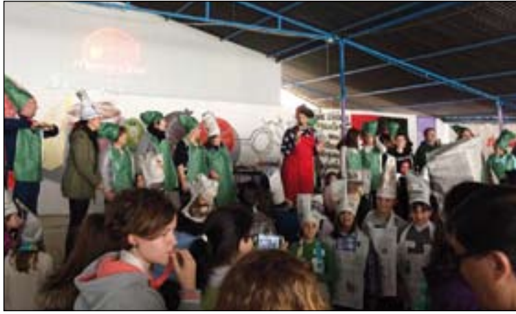
Dinámica que se llevó a cabo durante el encuentro.

Desde Cáritas y ACG valoran muy positivamente esta acción de sensibilización que "ayuda a recordar la importancia y el valor social que tiene la dignidad de tantas personas".